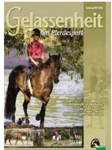
FNverlag, Warendorf, 2007, 168 Seiten, 14,90€ (D)

Insgesamt ein gut lesbares Buch, aus dem langjährige Erfahrung mit Pferden insbesondere in der Haltung spricht und das wertvolle Tipps zum Thema gelassener Umgang mit dem Partner Pferd geben kann.